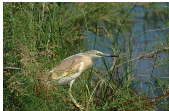
Le Héron crabier, une espèce classée "quasi menacée" dans la Liste rouge nationale.